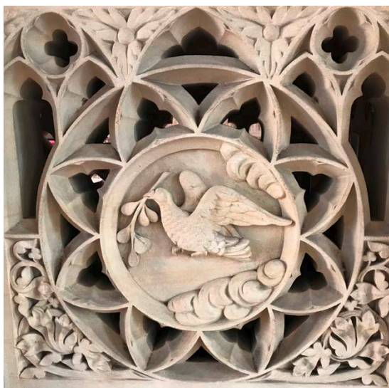
Altar St. Viktor, Damme

1. Lesung: Apostelgeschichte 2,1-11 | 2. Lesung: 1. Korinther 12,3b-7.12-13 | Evangelium: Johannes 20,19-23