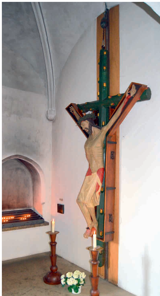
Im Angesicht des Kreuzes

Ich glaube an einen Gott, der das Leben und die Lebendigkeit will. Ich glaube an einen Gott, der mich gewollt hat, noch bevor meine Eltern wussten, dass es mich gibt, ich glaube an einen Gott, der Ja zu mir sagt.