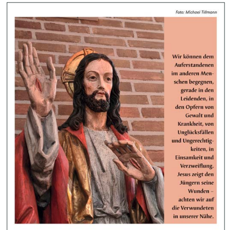
Wir können dem Auerstendenden in anderen Menschen begegnen, gerade in den Leidenden, in den Opfern von Gewalt und Krankheit, von Unglücksfällen und Ungerechtigkeiten, in Einsamkeit und Verweilung. Jesus zeigt den Jüngern seine Wunden – achten wir auf die Verwundeten in unserer Nähe.