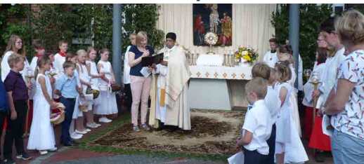
Altar beim Rathaus